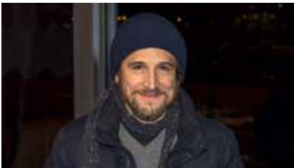
Guillaume Canet

Derrière le gag – Guillaume Canet qui veut à tout prix paraître rock, et donc jeune –, votre film ne dit-il pas quelque chose de notre monde ?