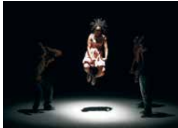
Eloge Du Puissant Royaume © Park Sang Yun