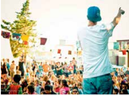
Petit K

La force du festival HIP OPsession , c'est de présenter toutes les facettes du mouvement à tous les publics. Loin des clichés qui voudraient que le hip hop ne soit qu'une affaire de d'jeun's, voilà quelques propositions pour vivre le festival en famille. # Patrick Thibault