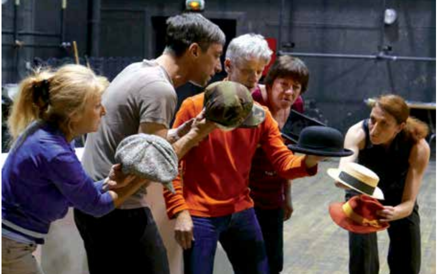
Le melon qui, répétition