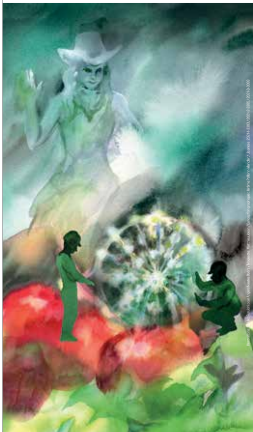
Concerts en scène de Saint-Nazaire / L'opéra 2024-2025 / 2024-2025 / 2024-2025