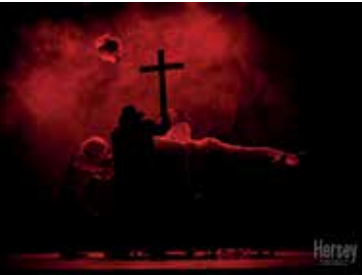
La véritable histoire de Dracula © Hersey