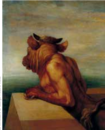
Le Minotaure © George Frederic Watts

Mardi 5, mercredi 6 et jeudi 7 novembre à 19h. le lieu unique, Nantes.