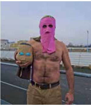
Who cares ? © Bignon