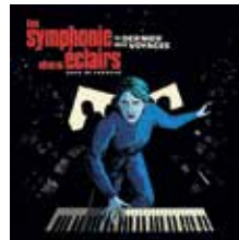
LA SYMPHONIE DES ÉCLAIRS (LE DERNIER DES VOYAGES), sortie 25 octobre.

Toutes les côtes. Prendre un vélo et partir sur la côte sauvage, c'est fantastique. La Loire à vélo aussi.