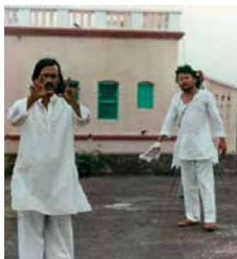
Nirad Mohapatra

« Ce film qu'on croyait perdu à jamais ressuscite après un long travail de plus de trois ans de restauration. Seul film de fiction de ce cinéaste dont l'œuvre est principalement documentaire, Maya Miriga est un joyau. »