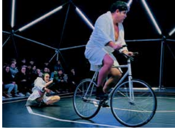
La Nuit du cirque - Mentir lo minimo