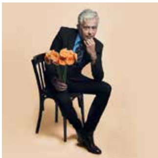
Pascal Parisot