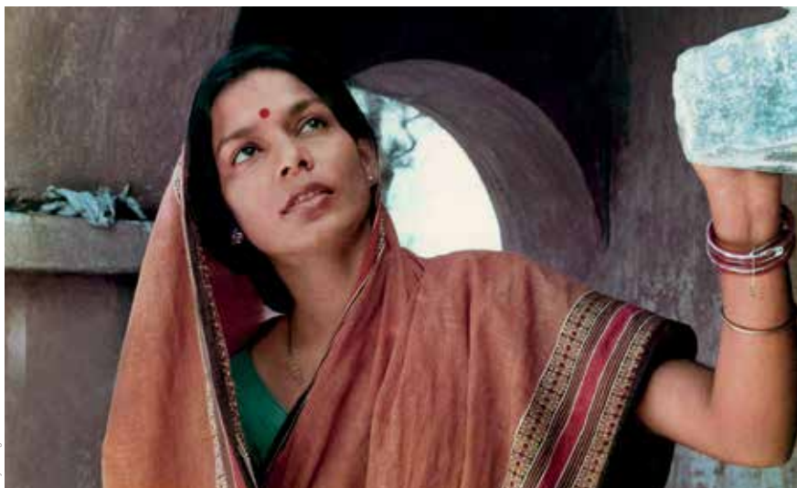
Maya Miriga © Film Still