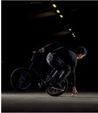
Foutoir céleste