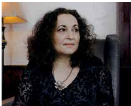
Emil Ferris