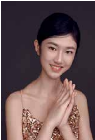
Sophia Liu © DR