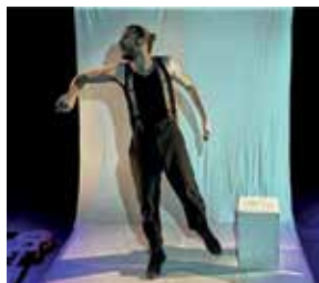
© Cie le Road Movie Cabaret

Samedi 14 décembre à 20h30. Théâtre Municipal Pazenais, Sainte-Pazanne. À partir de 7 ans