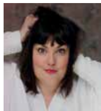
Morgane Delamare © DR