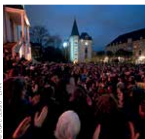
Les 100 voix de La Chorale du Voyage