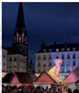
Le Voyage en hiver 2024

Place Félix Fournier, samedis 30 novembre, 7, 14, 21 décembre et 4 janvier à 16h30. À Noël aux Nefs, le 21 décembre à 17h30.