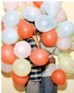
Laurence Bagot - In'ry a pas d'mousseaux en'jan - 2014

SUR TES LÈVRES Une exposition proposée par le Frac des Pays de la Loire et le Lieu Unique, Nantes, jusqu'au 12 janvier 2025.