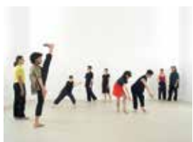
© D. Oline - T. Montinat