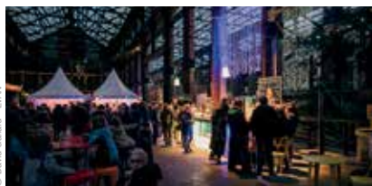
Noël aux Nefs - Les Machines de l'Île