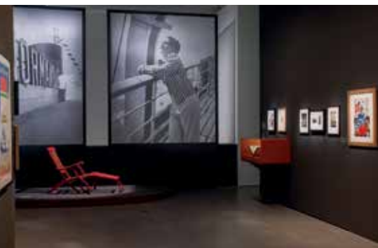
Vue de l'exposition