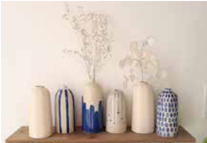
Les Échappées belles - Rose Cobalt