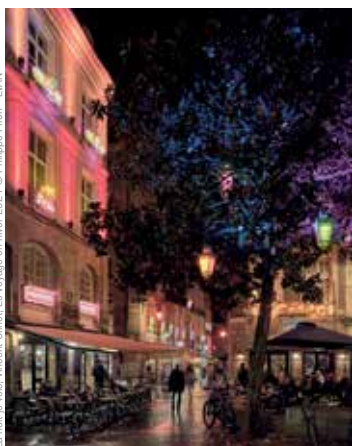
La nuit je vois. Vincent Olinet. Le Voyage en hiver 2024.