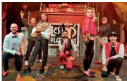
Les Fo'Plafonds